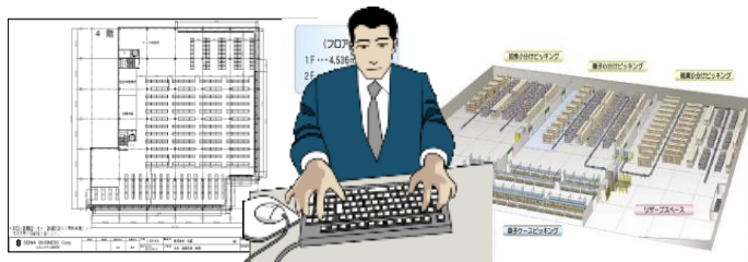
CAD図面・パース作成